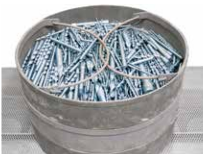
Воронение сверел водяным паром в печи серии NRA, см. страницу 16