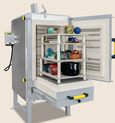
Four chambre NW 300 de 2012