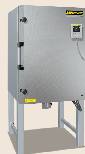
Four chambre N 200 de 2015