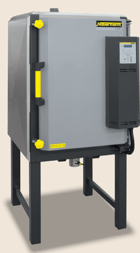
Four chambre N 200 E de 2006