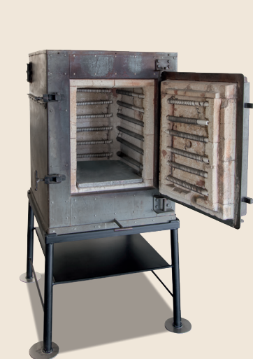
Modèle 14/S de 1949