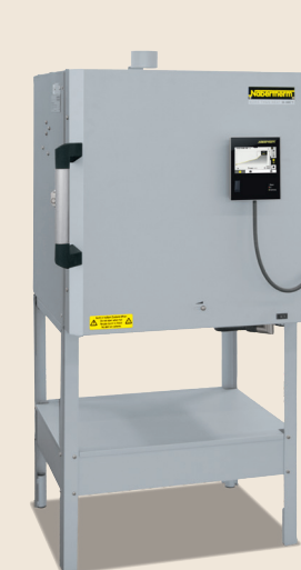
Four chambre N 70 E de 2021