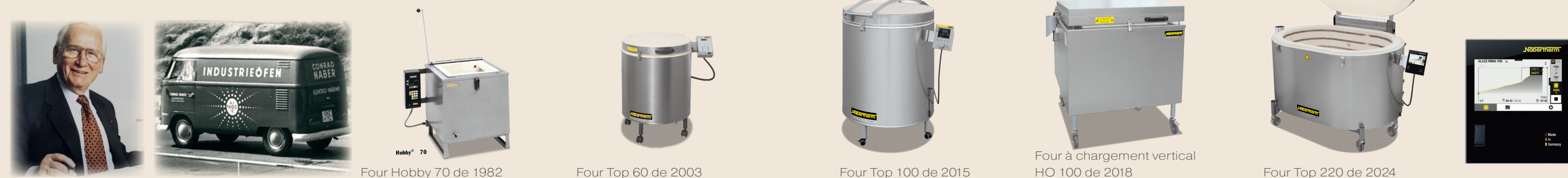
Four Hobby 70 de 1982

Nabertherm passe au solaire Nos fours de cuisson associent une efficacité énergétique optimale et donnent d'excellents résultats de cuisson. Grâce au « Mode Solaire » du programmeur, le four peut utiliser le courant d'installations photovoltaïques.