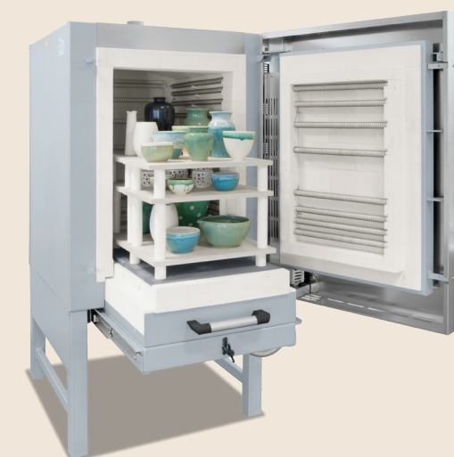
Four chambre NW 300 de 2024