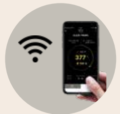
Mobile Überwachung mit der MyNabertherm App