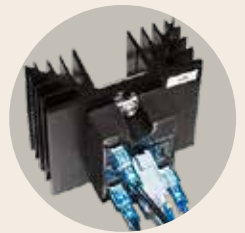
Geräuscharme Schaltung der Heizung über Halbleiterrelais