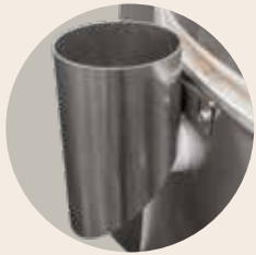
Bypass-Stutzen zum Anschluss eines Abluftrohrs