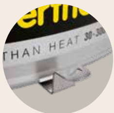
Stufenlos einstellbare Zuluftöffnung im Boden und Abluftöffnung an der Seite für gute Be- und Entlüftung und für schnellere Abkühlzeiten