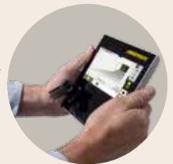
Abnehmbarer Controller mit Touchbedienung (siehe Seite 58)