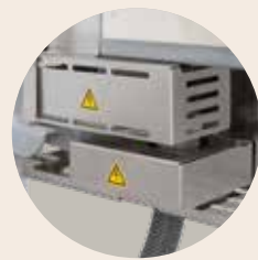
炉门的接触保护开关