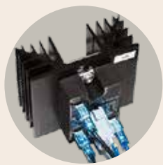
低噪音电子继电器