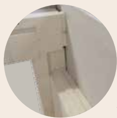
多层耐火隔热材料由轻质耐火砖制成