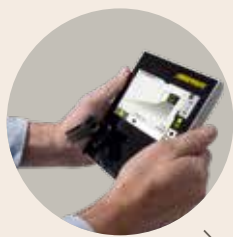
带触摸操作的可拆卸控制器(第58页)