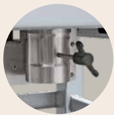
半电动进气挡板，适用于300升及以上的箱式窑