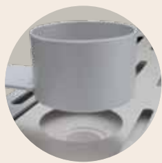
废气排气口，适用于300升及以下的箱式炉