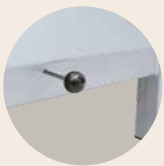
手动进气滑阀，适用于440升及以上的箱式炉