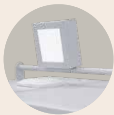
电动马达驱动的排气盖，适用于440升及以上的箱式炉