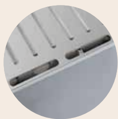
双层炉壳可实现低的外壁温度