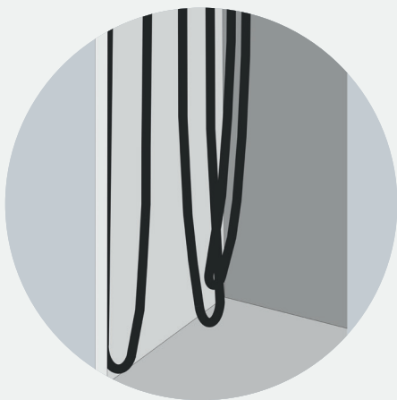
初始加热后的变形不会影响其功能